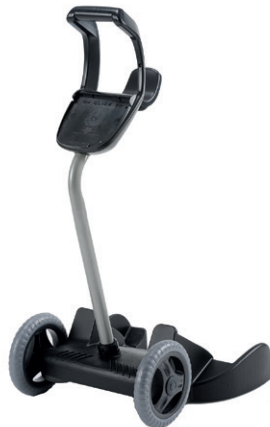
Transportwagen Transportna kolica