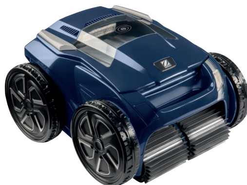
RA 6500iQ RA 6800iQ RA 6900iQ