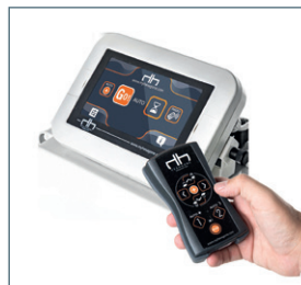
Touch Screen Zaslon osjetljiv na dodir