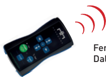
Fernbedienung für alle Robotersauger Daljinski upravljač za sve robotske usisavače