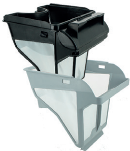
Duale Filterfähigkeit Mogućnost dvostruke filtracije (150/60 µ)