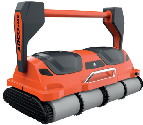
Poolsauger ARCO MAX