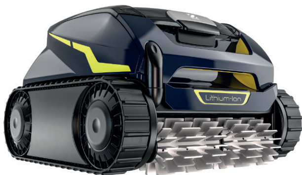
RF 5400 – FreeRider